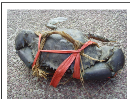
珍寶海鮮樓每人一隻 1 公斤螃蟹