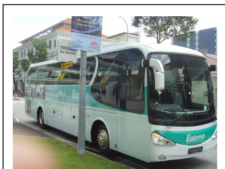
使用全新 2 年內新車